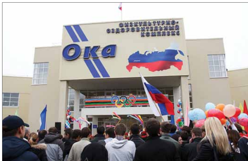
На открытии ФОК в Дзержинске

О.Ю. Сулима, министр финансов Нижегородской области