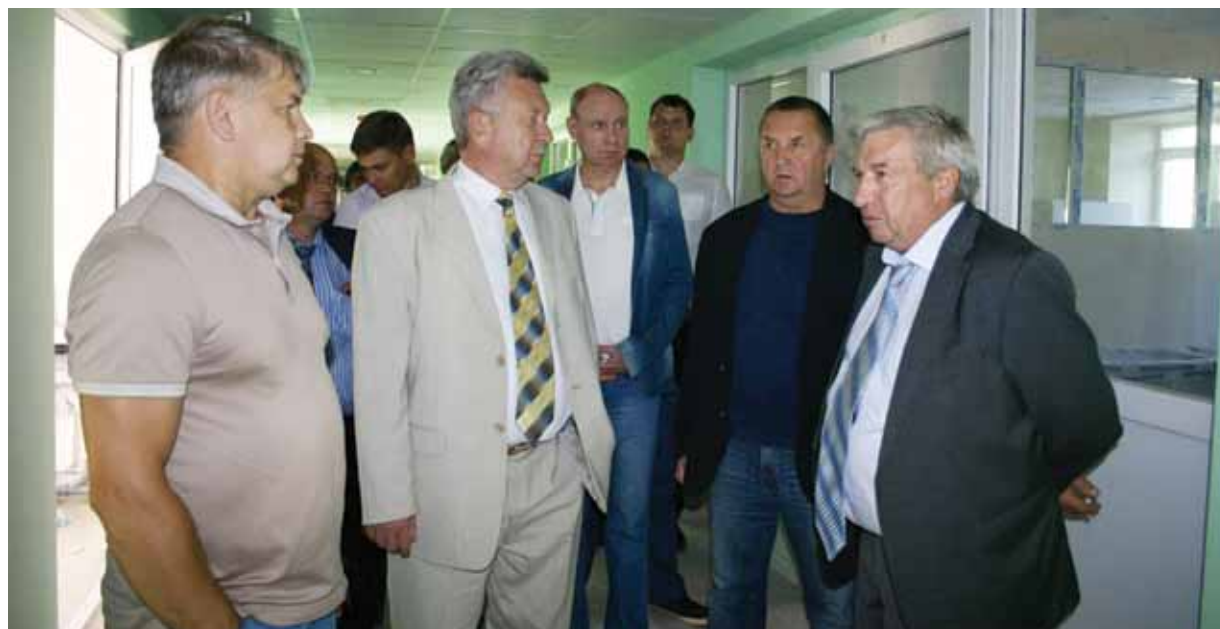
Выездное совещание с руководством Борского района

Другое дело, что времена меняются, и задачи меняются. У нас здесь скучно не бывает хотя бы потому, что каждые полгода федеральная власть меняет правила игры. Я всегда говорю: хотя бы 3-4 года не меняли эти правила, и мы бы в таком случае намного лучше и с большим эффектом могли работать, но нет, правила постоянно меняются, и перед нами ставятся задачи, решать которые до сих пор не приходилось. Замечу, что