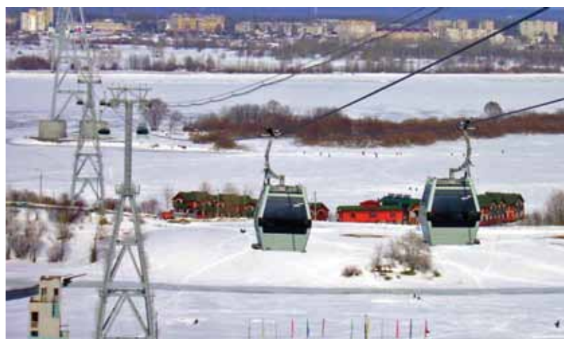
Канатная дорога, соединившая Бор с Нижним Новгородом, исправно работает и зимой

Проблема еще и в том, что в нашем деле нельзя просто обозначить самые приоритетные задачи и затем спокойно обеспечивать их финансирование, а менее приоритетные отложить до лучших времен. Работа построена так, что, если мы не гарантируем, к примеру, в течение первых двух месяцев года предоставление определенных средств на определенные цели, то можем лишиться очень большого объема финансовой поддержки из ▶