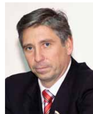
И.Н. Карнилин, глава города Нижнего Новгорода