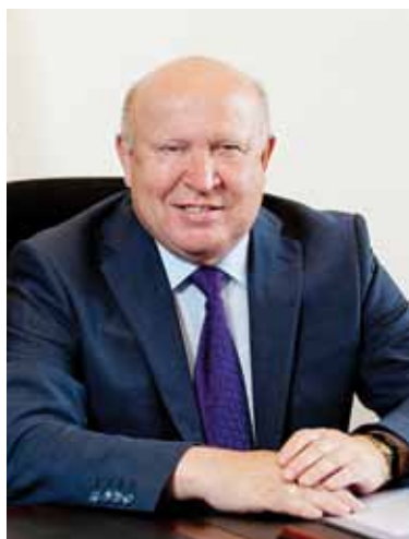
Губернатор Нижегородской области В.П. Шанцев

Позвольте мне сегодня, в день Вашего 60-летнего юбилея, присоединиться к многочисленным поздравлениям, которые звучат в Ваш адрес от коллег, друзей, единомышленников, земляков! Примите самые искренние пожелания здоровья, счастья и профессиональных успехов! Пусть достигнутое дает Вам стимул для движения вперед и помогает в покорении новых высот!