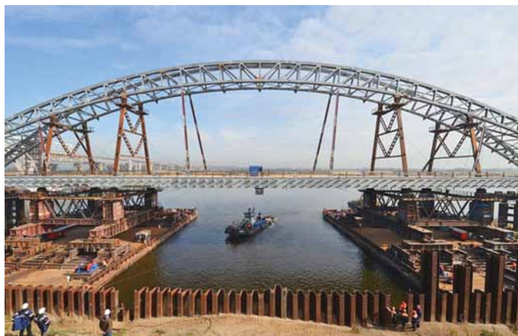
На строительстве нового Борского моста